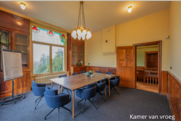
Kamer van vroeg