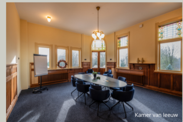
Kamer van leeuw